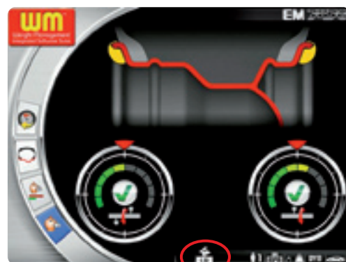
Videata della selezione veicoli veloci (lepre)

Solo con Less Weight questi valori, fondamentali per l'equilibratura ideale, vengono selezionati dall'operatore e automaticamente il programma calcola tutti gli altri parametri.