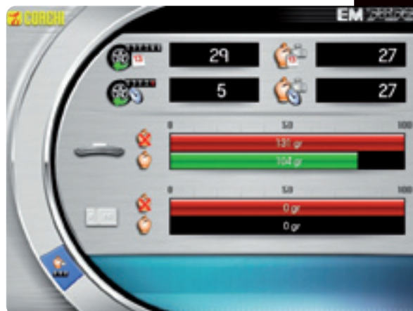
Videata statistica risparmio peso

I valori di risparmio vengono automaticamente calcolati e visualizzati dal programma: