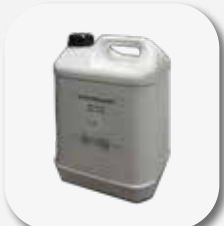
Olio idraulico 10 l. Oil filling 10 ltr.