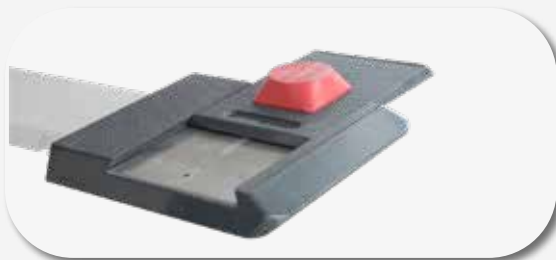
Supporti XY realizzati in una speciale lega di alluminio XY-pads available are made of a special aluminium alloy