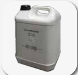
Olio idraulico 17 l. Oil filling 17 ltr.