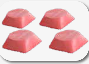
Set di tamponi in gomma 40 mm, 120x120xØ100 (4 pz.) Set of Rubber blocks 40 mm, 120x120xØ100 (4 pcs)