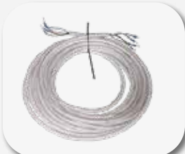
Set di cavi 10 m. Set of cables 10 m.