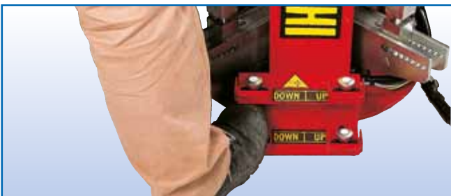
Pedaliera con comandi a "uomo presente" "Dead man" pedal control unit Pédalier avec commande à "homme présent" "Totmann-Steuerung" mittels Pedal Mando a pedal a operador presente