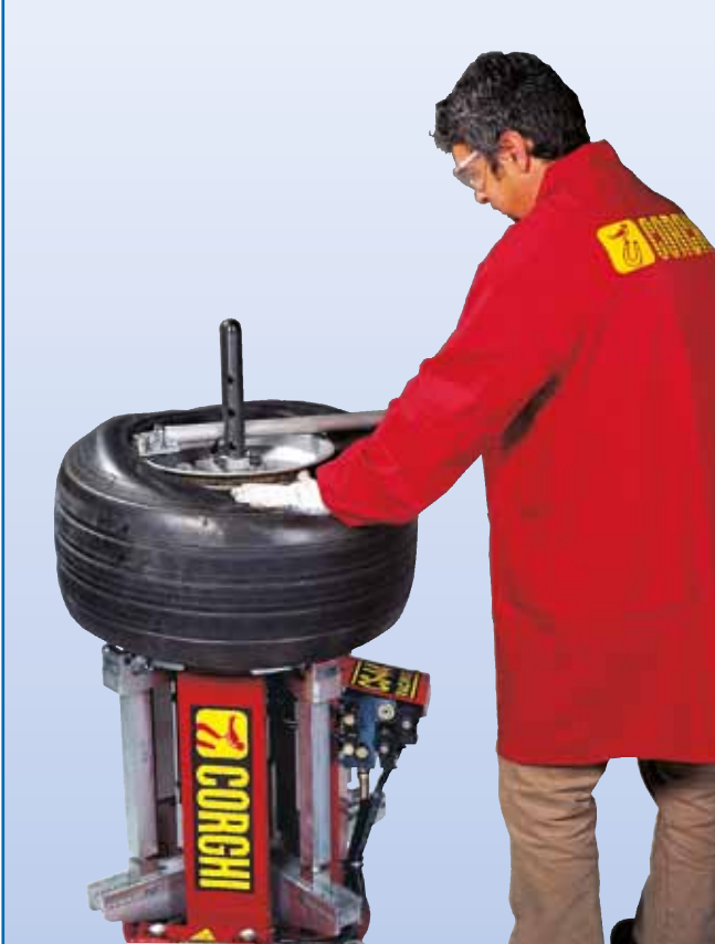
Operazione di montaggio Mounting operations Opération de montage Montagevorgang Operación de montaje