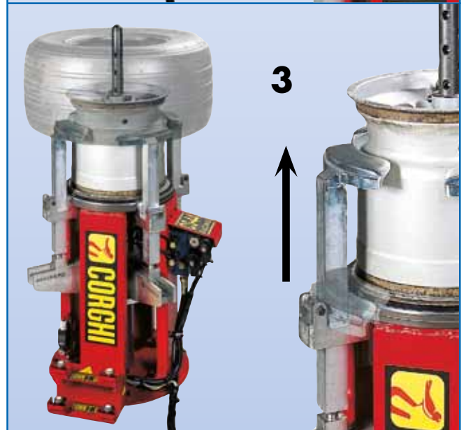
Stallonatore idraulico a corsa lunga Long stroke hydraulic bead breaker Détalonneur hydraulique à course longue Langhubiger, hydraulischer Abdrücker Destalonador hidráulico de larga carrera